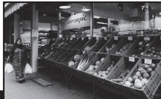
TEKST: ELIEN VERSCHUEREN

rels in de auto niet te weten waar ze wonen. Shari, die TEW volgt, kan de mannen wel te baas: "Vaak spreken ze mij aan om de weg te vragen. Vroeger trapte ik daarin, maar nu niet meer. Die gasten kennen de weg hier waarschijnlijk beter dan ik". Ze lacht er smakelijk om. Minder leuk zijn de verhalen over de junkies die ze soms ziet. De meeste studenten storen zich niet aan de verschillende culturen, maar wel aan de verslaafden en de dealers, de Jambers-achtige figuren. Thomas solliciteert en is bezig aan zijn thesis. Hij woont samen met zijn vriendin vlakbij het Sint-Jansplein en ook zij wonen hier graag: "Ik woon al enkele jaren in 't Stad en sommige dingen zijn toch al verbeterd. Vroeger werd je op elk moment van de dag aangesproken door dealers op het De Coninckplein, dat is nu veel minder."