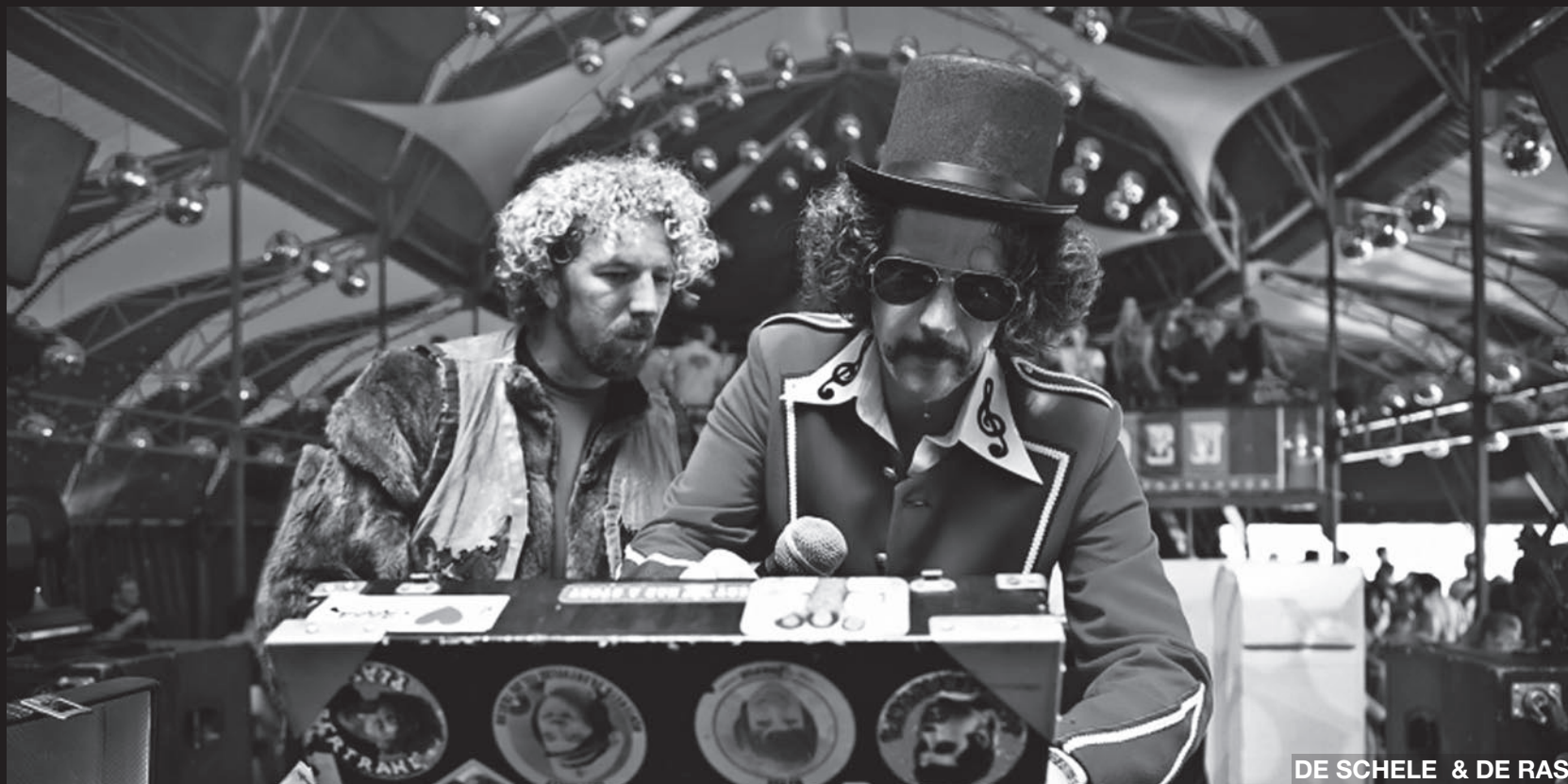
DE SCHELE & DE RAS